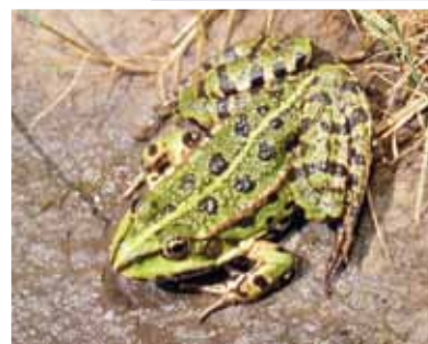
צפרדע נחלים - פרט בוגר

פסקה 3: הראשן, החי במים, הופך לצפרדע, החיה ביבשה. זה המקור לשמה של הקבוצה: דו-חיים. הצפרדע הבוגרת חיה באזורים יבשתיים לחים הקרובים למים.