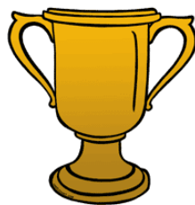
מסה: 350 גרם