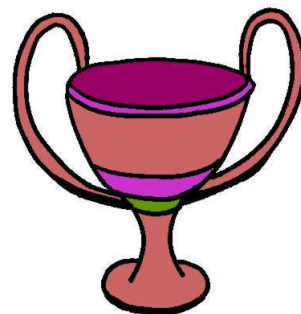
מסה: 350 גרם